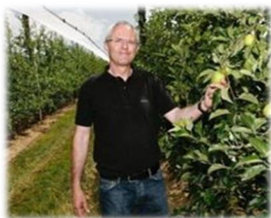
Producteur pour MEYLIM

Intermédiaire(s) entre le producteur et le SIVU : 1