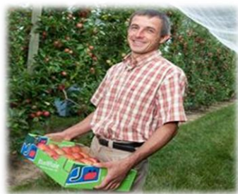
Producteur pour BLUE WHALE

Intermédiaire(s) entre le producteur et le SIVU : 1